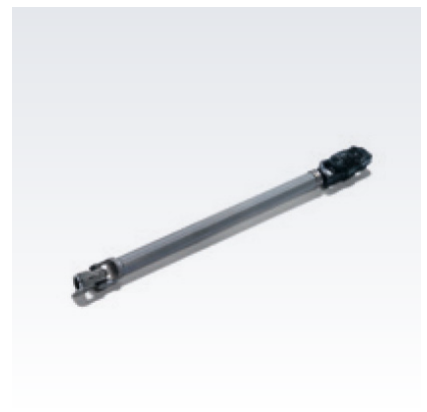
Oryginalna półoś układu kierowniczego MAN