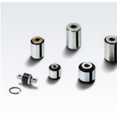
Oryginalne elementy osi MAN