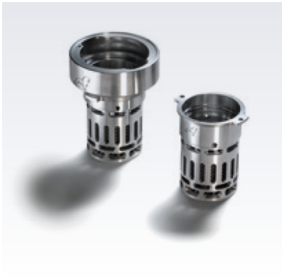
Oryginalne zabezpieczenie wlewu paliwa MAN

Dostosuj swój pojazd za pomocą oryginalnych akcesoriów MAN i zwiększ swoje bezpieczeństwo i komfort.