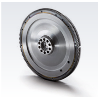
Oryginalne koła zamachowe MAN

Oryginalna tarcza dociskowa sprzęgła MAN i oryginalna tarcza sprzęgła MAN są również dostępne jako oddzielne części.