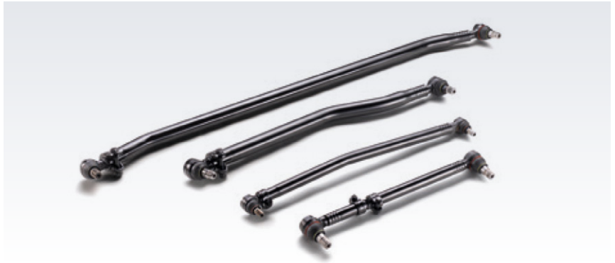
Oryginalne przeguby i drażki kierownicze MAN