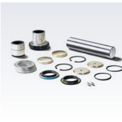
Oryginalne zestawy naprawcze zwrotnic MAN