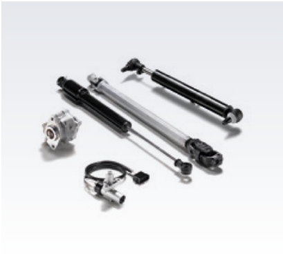
Oryginalne części układu kierowniczego MAN

Drażki kierownicze wzdłużne i poprzeczne oraz pompy wspomagania są podstawowymi elementami układu kierowniczego, dla których dopuszcza się jedynie bardzo wąski zakres tolerancji wykonywania poleceń w procesie kierowania kołami. Wszystkie komponenty są narażone na działanie dużych sił, a w niektórych przypadkach na wysokie temperatury. Jedynie wysoka jakość wykonania zapewni wytrzymałość na wpływ tych ekstremalnych warunków i zagwarantuje najwyższy poziom bezpieczeństwa.