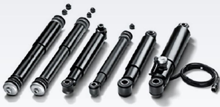
Oryginalne amortyzatory MAN

Amortyzatory, wraz z zawieszeniem, zapewniają pewny kontakt kół z nawierzchnią jezdnią. Utrzymują pojazd bezpiecznie na swoim pasie ruchu, zapewniają krótką drogę hamowania i znacznie ułatwiają panowanie nad pojazdem.