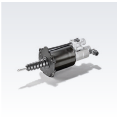
Oryginalne pompy sprzęgła MAN