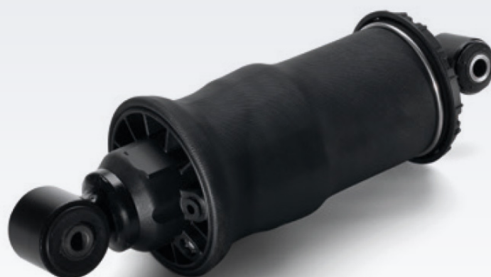
Oryginalne miechy pneumatyczne MAN