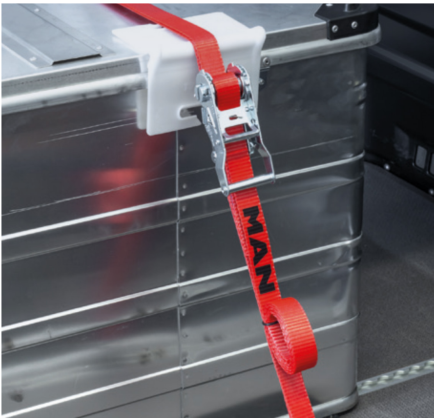
Oryginalne pasy mocujące MAN